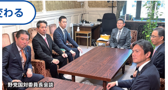
野党国会対策委員長会談

た。そして、物価高対策としてのガソリン・軽油の暫定税率廃止、学校給食の無償化、高校無償化の拡充、介護や保育の現場で働く方々の処遇改善、高額療養費