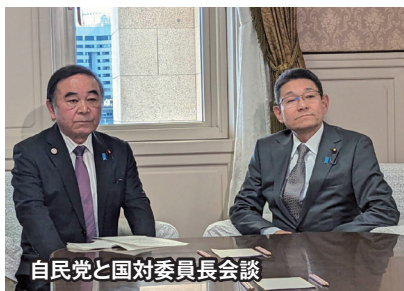
自民党と国会対策委員長会談

立憲民主党は70人規模の歳出改革作業チームを立ち上げ、各省庁の予算案を徹底的に精査し、活用されていない基金や必要性の乏しい予算の見直し、膨大な予備費の減額で約3.8兆円の財源を確保しまし