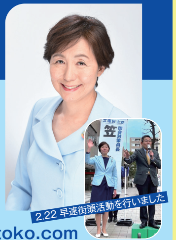
2.22 早速街頭活動を行いました