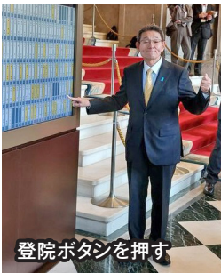
登院ボタンを押す