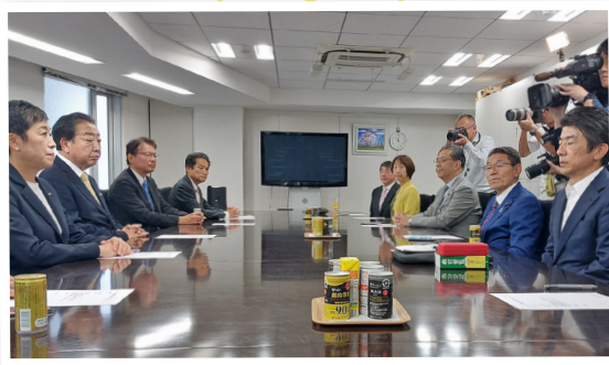
党の執行役員会に出席 10月28日