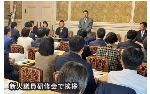
新人議員研修会で挨拶