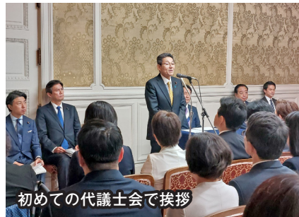
初めての代議士会で挨拶